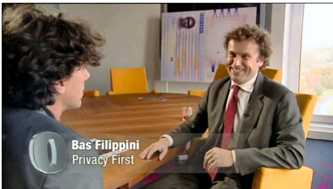
© VARA Ombudsman 12 november 2010: interview over het Paspoortproces.

Sinds de zomer van 2009 verschijnt Privacy First regelmatig in de media bij reportages en interviews over de nieuwe Paspoortwet, het Paspoortproces en verwante kwesties rond privacy en biometrie. Zo trad Privacy First in 2010 o.a. op bij EénVandaag en de VARA Ombudsman: