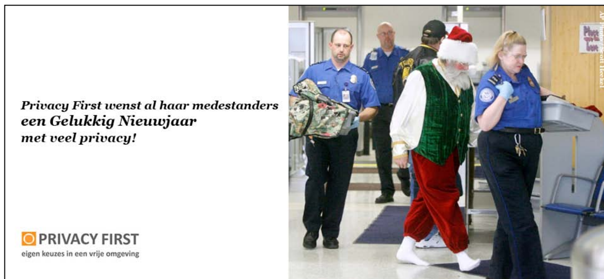
Nieuwjaarswens Privacy First 2011 (foto: bodyscan op Amerikaanse luchthaven).

Een ander onderwerp dat Privacy First sinds 2010 zorgen baarde was de invoering van bodyscans op luchthavens. Met name de verplichte röntgenscanners op Amerikaanse luchthavens waren ons een doorn in het oog. Op onderstaande Nieuwjaarswens na heeft dit in 2011 echter niet tot (reeds geplande) actie van Privacy First hoeven leiden. Vooralsnog is op Schiphol immers sprake van vrijwillige i.p.v. verplichte millimeter wave scanners, in lijn met het motto van Privacy First: “eigen keuzes in een vrije omgeving”.