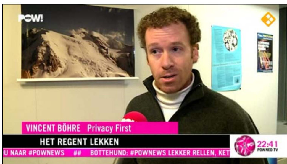
© PowNews 25 november 2011: Privacy First steunt oproep tot Nationaal Privacy Debat.